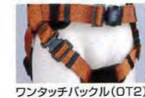
ワンタッチバックル(OT2)